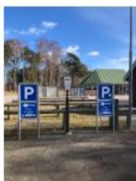
1 LADESTANDER TIL EL BILER 10 STK