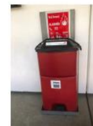
4 HÅNSPRØJTE PÅ 1 SAL VED LEJ 406, 204, 207, 214,216