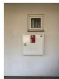
3 BRANDSLANGE I STUEPLAN VED LEJ 305, 103 112, 116